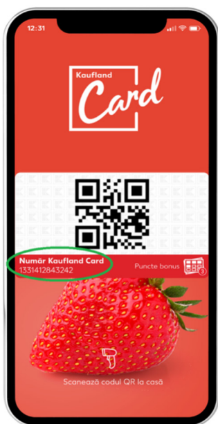
Figură 1. Unde se află numărul de Kaufland Card digital