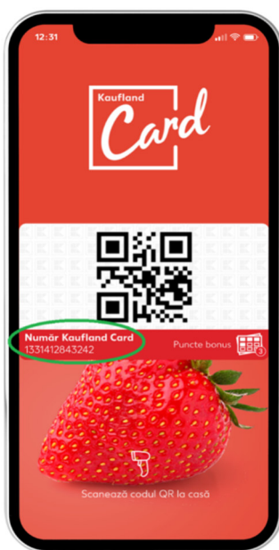
Figură 2. Unde se află numărul de Kaufland Card digital