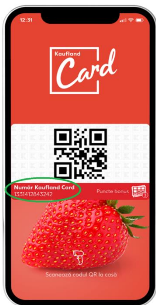
Figură 1. Unde se află numărul de Kaufland Card digital